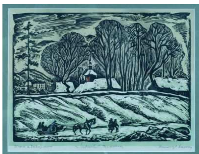
Ludwik Tyrowicz, Zima w Zakopanem, drzeworyt

W pierwszym, heroicznym okresie szkoły, „na Narutowicza” Ludwik Tyrowicz mieszkał w szkolnej kuchni, co, podobno, jak na ówczesne warunki lokalowe nie było najgorszą opcją ze względu na fakt posiadania prądu i wody. In situ zapewne łatwiej było nadzorować dwie tworzone przez siebie placówki: na I piętrze szkołę średnią, na II - Wyższą Szkołę Sztuk Plastycznych. Warto zauważyć, że w tym czasie uczniowie szkoły mogli widywać na co dzień wykładowcę na II piętrze charyzmatycznego twórcę konstruktywizmu, przyjaciela Malewicza, Władysława Strzemińskiego, jednego z najwybitniejszych twórców sztuki XX wieku.