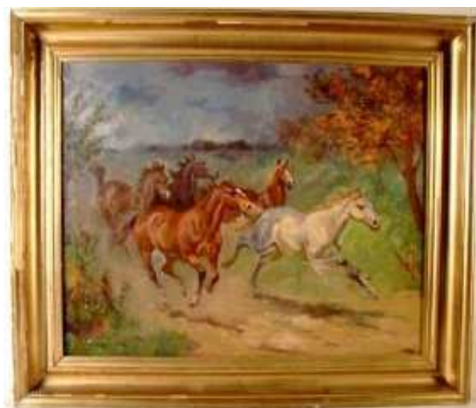
Geza Rozmus, Ścigając burzę, olej na płótnie