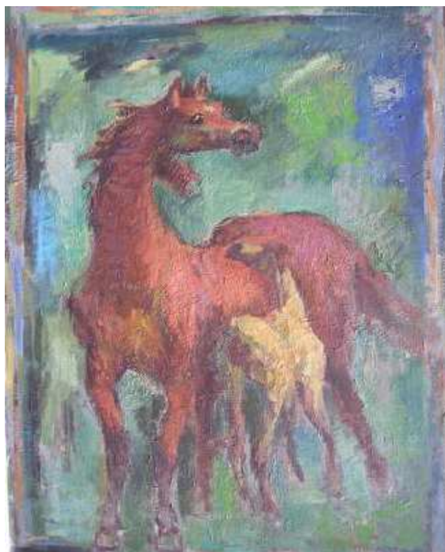
Geza Rozmus, Klacz ze źrebięciem, olej, płótno, 81x 65 cm